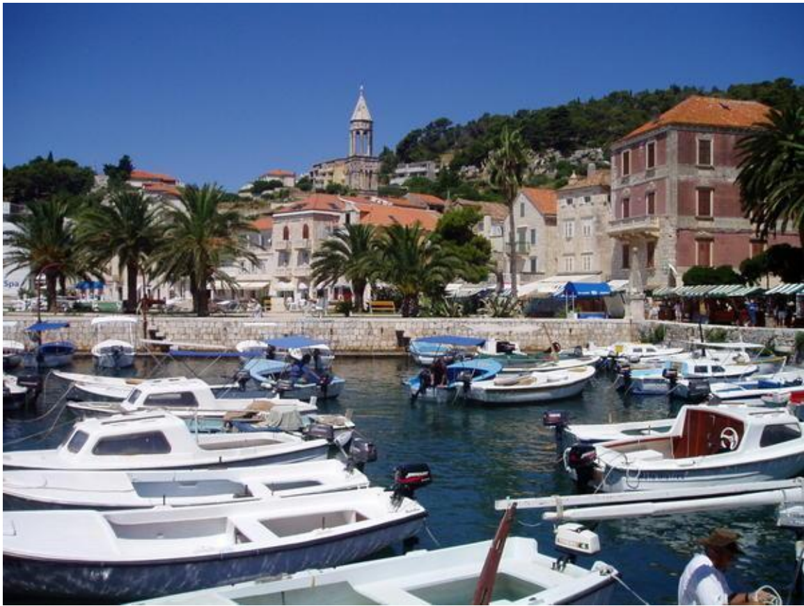
Palmizana Strand - Pakleni Inseln